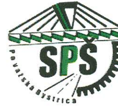
Stredná priemyselná škola Považská Bystrica